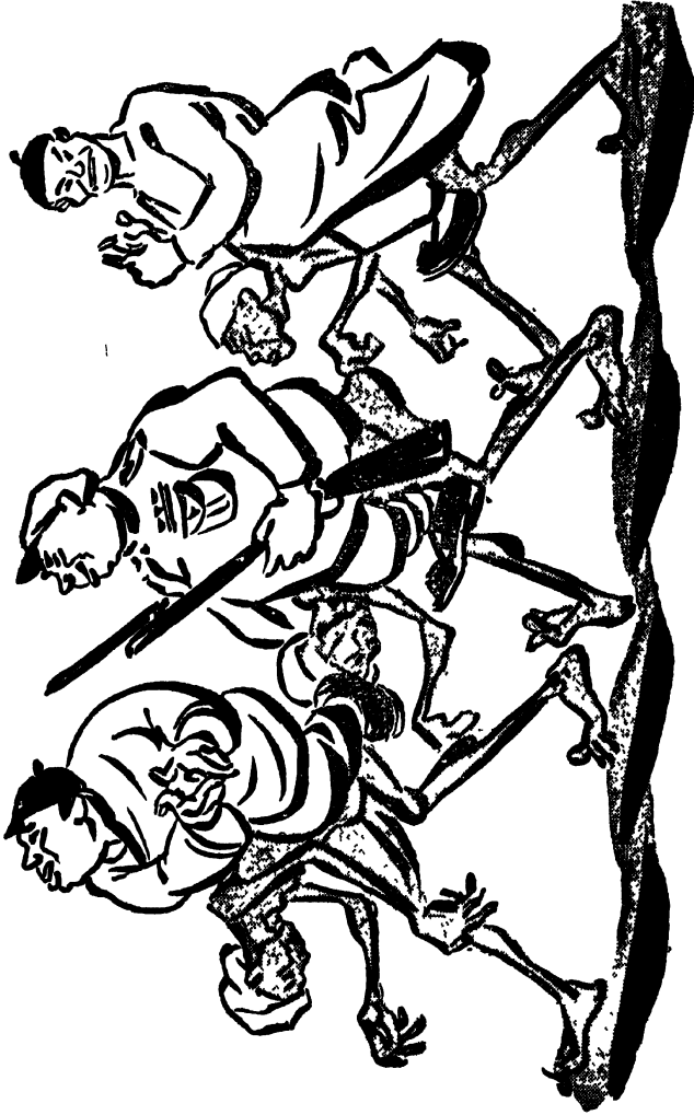
ಕೊಮಂಟಾಂಗ್, ಜಮಿನ್ದಾರ ಮತ್ತು ಲಂಚಕೋರ ಅಧಿಕಾರಿಗಳ ಸುಲಿಗೆಗೆ ಸಿಲುಕಿ ರೈತರು ನರಳುತ್ತಿದ್ದರು.